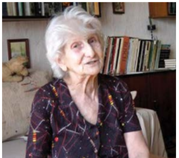
Kommunella a Mosca