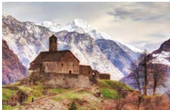
S.ta Maria al Castello, sullo sfondo il Pizzo di Claro

Richiudendo la porta della chiesa sembra di abbandonare un luogo segreto carico di mistero, con fantasie di dame e cavalieri che ci accompagnano fin giù sull'isola tra i due rami del Ticino: una piccola isola Tiberina nostrana che invita alla sosta prima di perdersi nella chiesa di San Nicolao, gioiello del romanico ticinese, una specie di macchina del tempo che ti catapultava in pieno Medioevo.